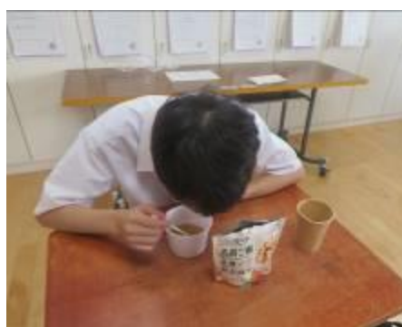
非常食の利用訓練