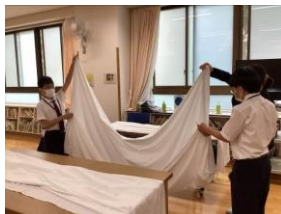
協力してシーツ畳み