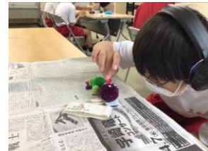
アニマルクリップ作り