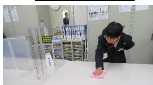
事務所では 先輩社員さんに倣って テーブル拭きを披露しました。