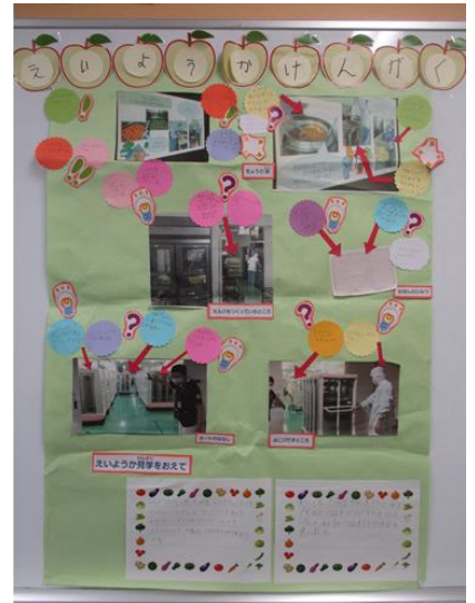
栄養科見学のまとめポスター