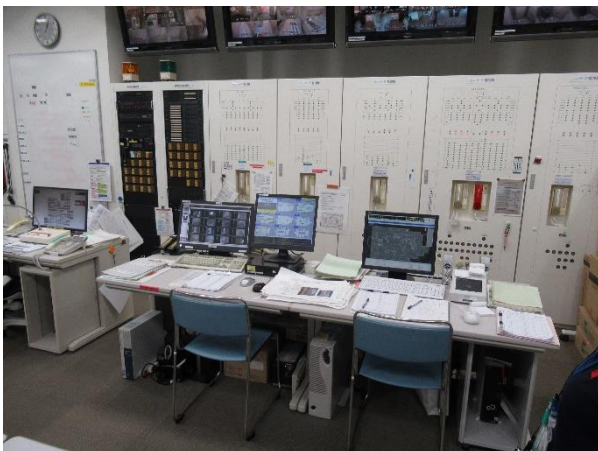
防災センター エレベーターシステム

11月17日に、1、2年生が防災センターを見学しました。壁一面の配電盤やエレベーターモニター、地下の免震構造の柱、自家発電装置のあるエリアを見せていただきました。生徒たちは、一つ一つの説明に熱心にメモを取っていました。病院の建物全体の安全を24時間体制で管理する仕事に、安心感や感謝の気持ちが湧き、そのことを感想にまとめました。