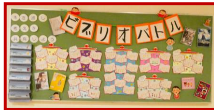
ビブリオバトルの投票結果の掲示