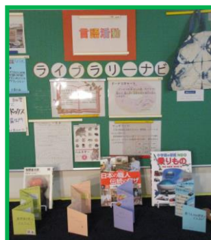
生徒が作製した ライブラリーナビ

自分が疑問に思うことや知りたいことを学校図書館や公共図書館から借りた本で調べ、じゃばら型のリーフレット(ライブラリーナビ)にまとめ、作製したものを病院内の行事で展示しました。見学したひだまり学級中学部の生徒から「分かりやすくまとめられている」など感想をもらい、作品を通じた交流ができました。