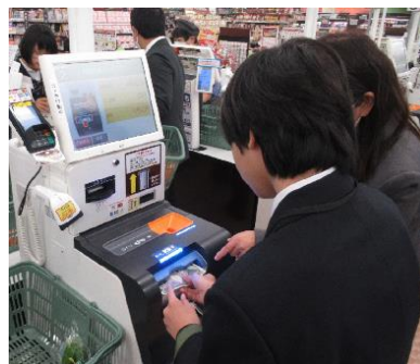
セミセルフレジに挑戦